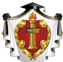
Адвокатская палата Рязанской области