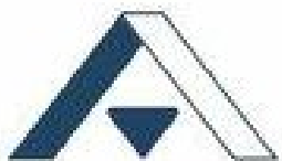
Центральное окружное отделение Арбитражного центра при РСПП