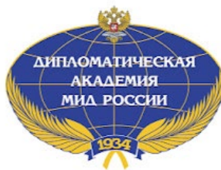
Федеральное государственное бюджетное образовательное учреждение высшего образования «Дипломатическая академия Министерства иностранных дел Российской Федерации»