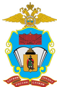
Федеральное государственное казенное образовательное учреждение высшего образования «Московский университет МВД России имени В.Я. Кикотя» (Рязанский филиал)