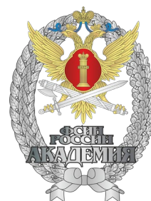
Федеральное казенное образовательное учреждение высшего профессионального образования «Академия права и управления Федеральной службы исполнения наказаний»