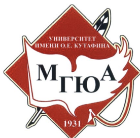
Федеральное государственное бюджетное образовательное учреждение высшего профессионального образования «Московский государственный юридический университет имени О.Е. Кутафина (МГЮА)»