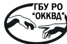
Государственное бюджетное учреждение Рязанской области «Областной клинический кожно- венерологический диспансер»