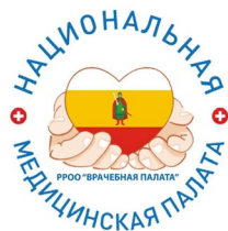
РЯЗАНСКАЯ РЕГИОНАЛЬНАЯ ОБЩЕСТВЕННАЯ ОРГАНИЗАЦИЯ «ВРАЧЕБНАЯ ПАЛАТА»