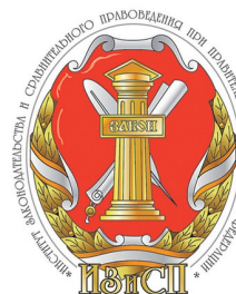
Федерального государственного научно-исследовательского учреждения «Институт законодательства и сравнительного правоведения при Правительстве Российской Федерации»