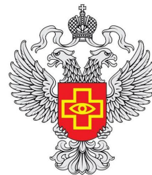
Территориальный орган Управления Федеральной службы по надзору в сфере здравоохранения по Рязанской области