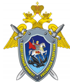
Следственное управление Следственного комитета Российской Федерации по Рязанской области