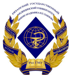
Федеральное государственное бюджетное образовательное учреждение высшего образования «Рязанский государственный медицинский университет имени академика И.П. Павлова» Министерства здравоохранения Российской Федерации»