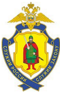
Управление МВД России по Рязанской области