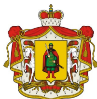
Министерство здравоохранения Рязанской области