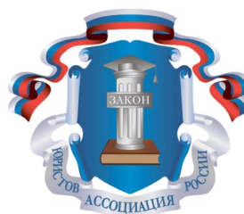
Ассоциации юристов России Рязанское региональное отделение