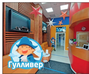
Гостей ИСЦ «Гулливвер» встречает просторный, яркий холл. Адрес: г. Уфа, ул. С. Перовской, д. 54, тел.: +7 (347) 287-72-76. Сайт: guliver-kids.ru

Семейная стоматологическая клиника «Гулливвер» с 2016 года предоставляет широкий спектр услуг для детей и взрослых. Она известна своим инновационным подходом к лечению и профилактике стоматологических заболеваний. В клинике установлено оборудование от известных мировых производителей. Врачи оперативно реагируют на каждое обращение и добиваются отличных результатов даже в нестандартных ситуациях. Клиника получила престижный статус Инновационного Центра Стоматологической Ассоциации России.