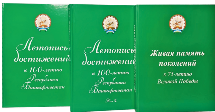
Предыдущие три тома проекта «Летопись достижений Республики Башкортостан»