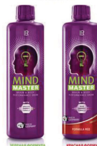
ЗЕЛЕНАЯ ФОРМУЛА 100мл

АКТИВНЫЙ СТАРТ С РАННЕГО УТРА, СПОКОЙСТВИЕ И ПРОДУКТИВНОСТЬ НА ПРОТЯЖЕНИИ ДНЯ ЗАРЯД ЭНЕРГИИ